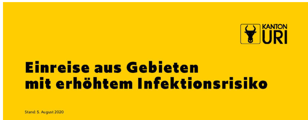
Abbildung 2 Einreise aus Gebieten mit erhöhtem Infektionsrisiko